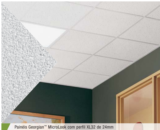
Painéis Georgian™ MicroLook com perfil XL32 de 24mm

O forro Georgian é econômico, com textura fina e tem boa resistência à impactos e arranhões